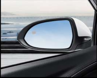
مرآة جانبية إلكترونية مدفأة