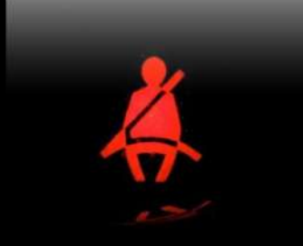
أشارات لأحزمة السلامة