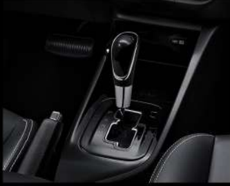
ناقل حركة ٥ سرعات