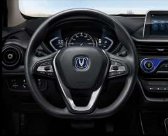
مقود متعدد الوظائف