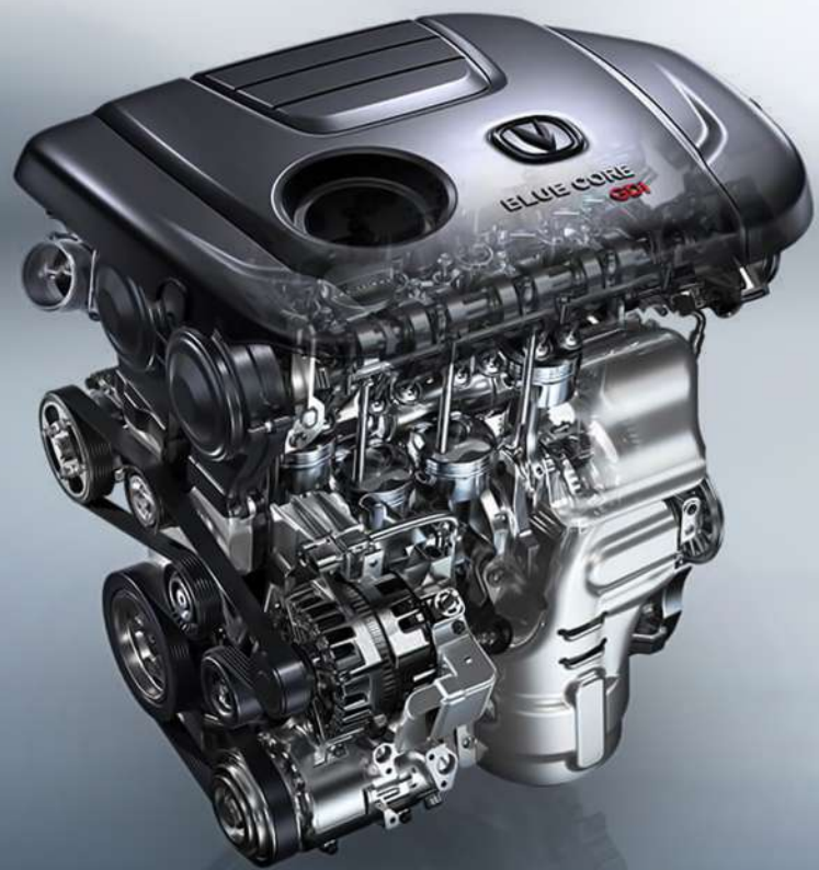
Blue Core 1.5 GDI 105 HP - 145 N.M