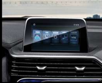
شاشة متعددة الاستخدامات