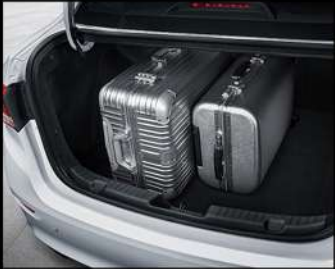
سعة تخزين كبيرة