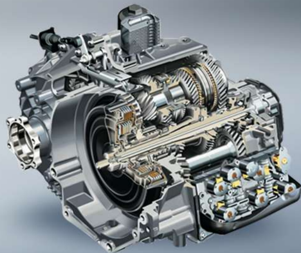
AISIN 5 Speed DCT