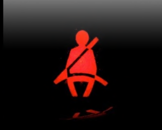
أشارات لأحزمة السلامة