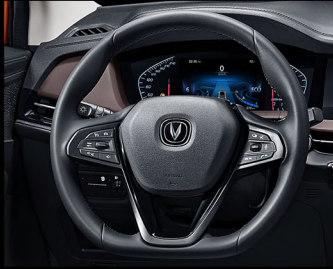
مقود متعدد الوظائف