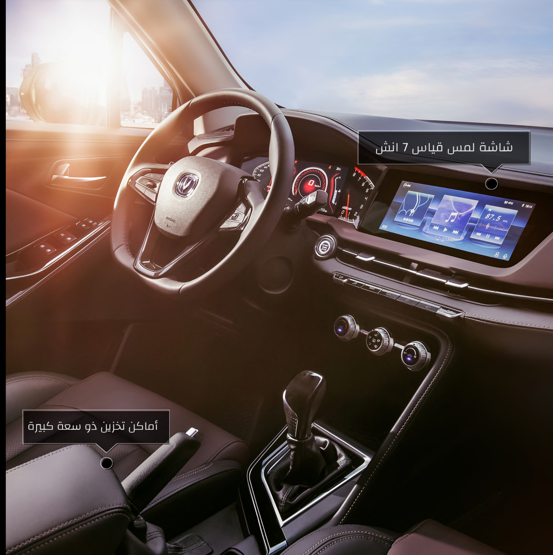
شاشة لمس قياس 7 انش