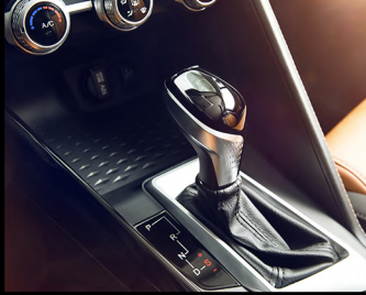
ناقل حركة ٥ سرعات