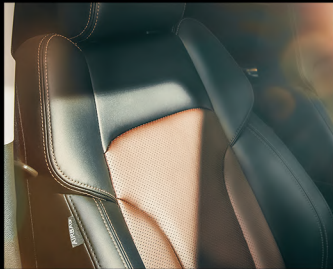
Nappa Leather Two Tone Color