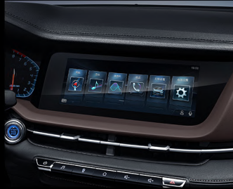
شاشة متعددة الاستخدامات