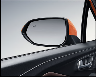
مرآة جانبية إلكترونية مدفأة