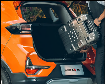
سعة تخزين كبيرة