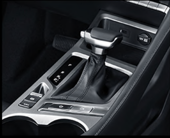
ناقل حركة ٧ سرعات رياضي