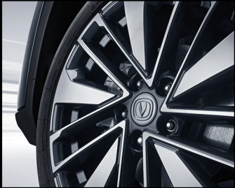
جنط كروم ذو لونين