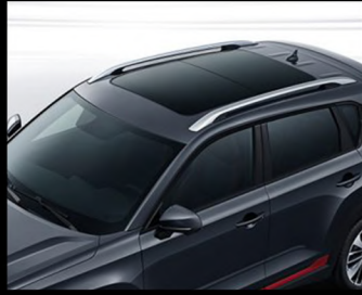
فتحة سقف كهربائية بانورامية