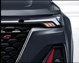
Full LED Technology