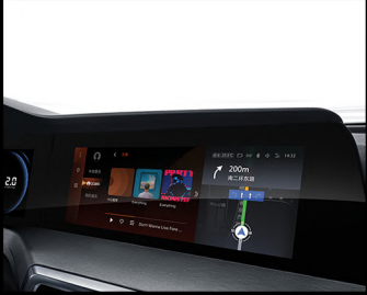
شاشة ذكية وشاشة تعمل باللمس