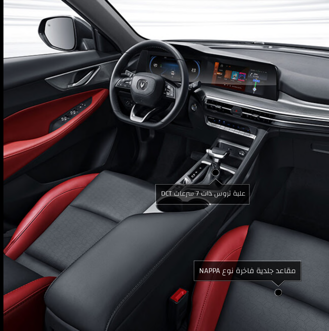
علبة تروس ذات 7 سرعات DCT