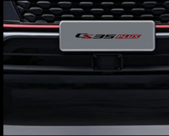
نظام التحكم بالسرعة المتكامل ACC