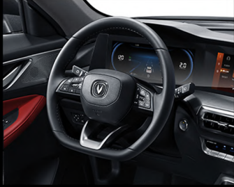
مقود متعدد الوظائف رياضي