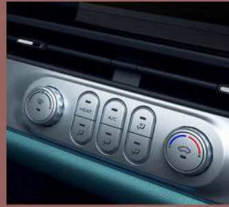
وحدة التحكم بالمكيف المركزي للمركبة