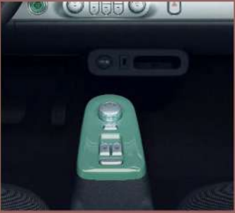
علبة تروس كهربائية