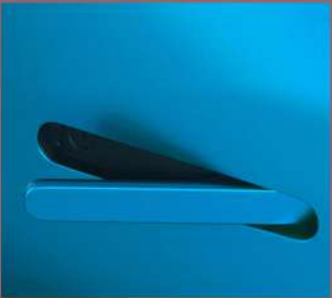
مقبض يد مخفي