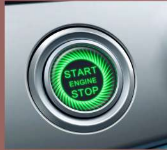
تشغيل المركبة بالبصمة