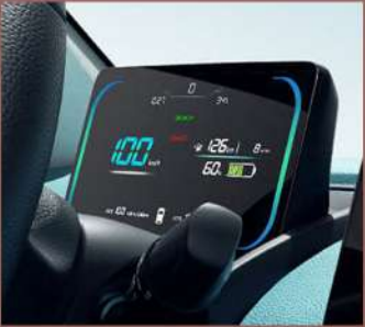
عدادات وشاشة معلومات وسطية