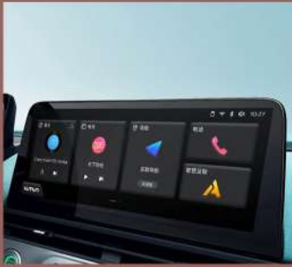
شاشة وسطية ذكية