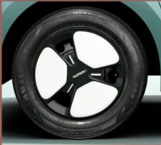
جنط ذو لونين