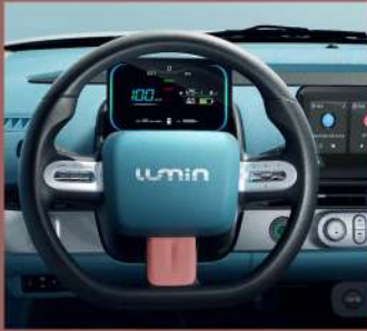
مقود رياضي متعدد الإستخدامات