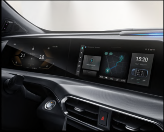
شاشة ذكية وشاشة تعمل باللمس