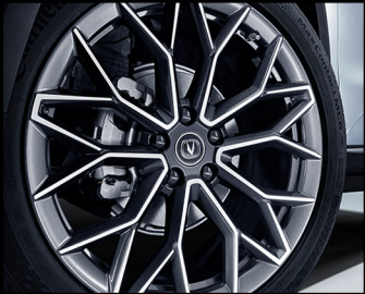
جنط كروم ذو لونين