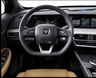
مقود متعدد الوظائف رياضي