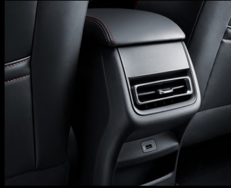
تكييف خلفي بالإضافة لـ USB Port