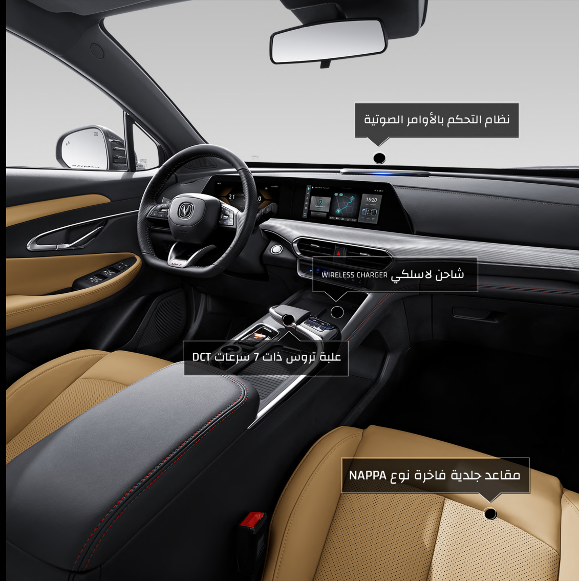
نظام التحكم بالأوامر الصوتية