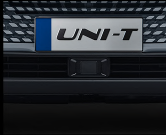
نظام التحكم بالسرعة المتكامل ACC