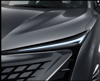
Full LED Technology