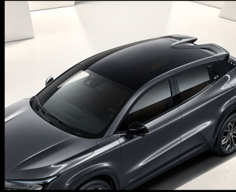
فتحة سقف كهربائية بانورامية