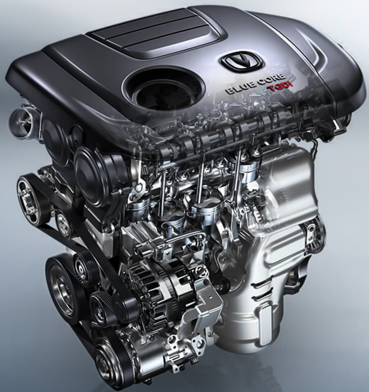
Blue Core 1.5 T GDI 177 HP - 300 N.M