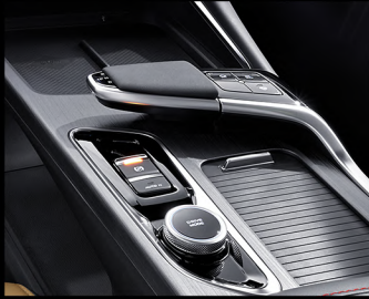
ناقل حركة ٧ سرعات رياضي